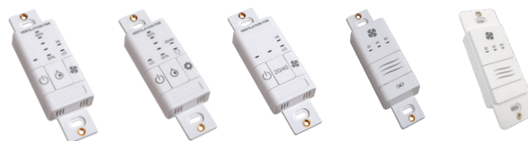
99-BC02 99-BC03 99-BC04 99-DET02 99-DET01

99-RX02 - Répéteur sans fil Lifebreath Augmente la portée des minuteries sans fil 99-DET02. Se branche dans une prise de courant de 120 V. Connectivité sans fil entre la commande principale et à la minuterie 99-DET02. Installation à mi-chemin entre la minuterie et la commande principale au mur si la minuterie est hors de portée.